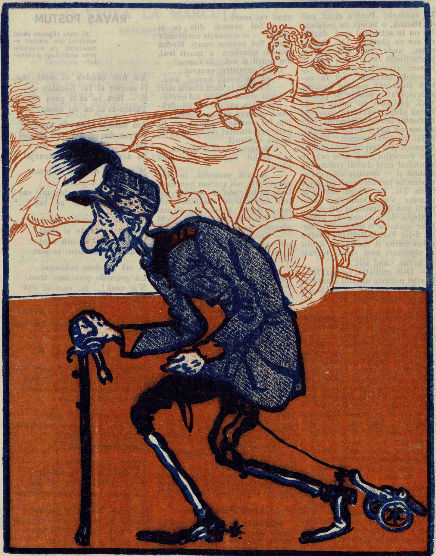
GLORIA — Când te gândești că acum șase ani eram amoretată lulea de hodorogu ăsta!...